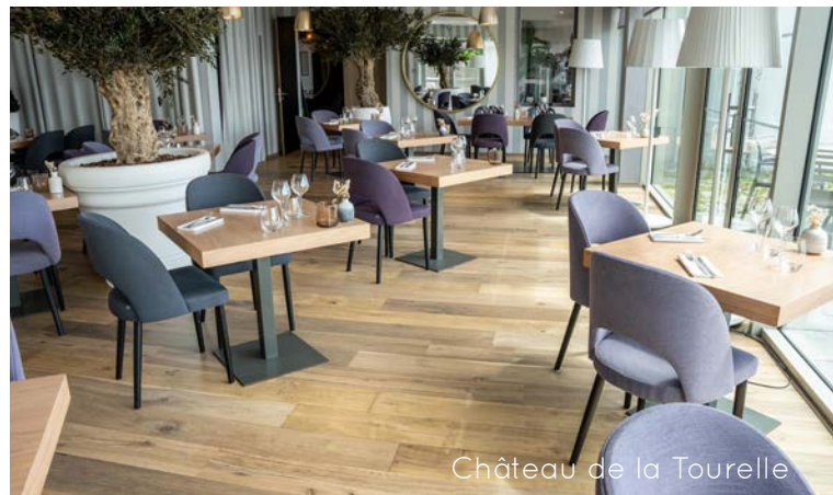
Château de la Tourelle